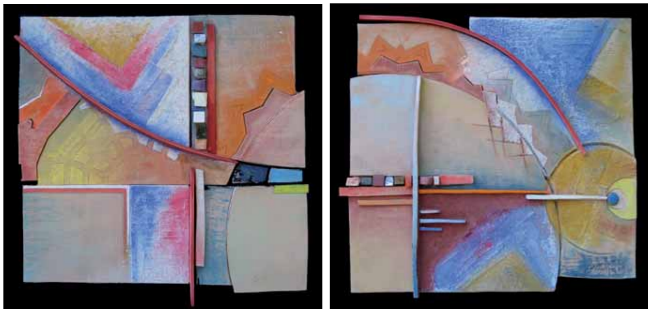
CIELI LONTANI DITTICO/OPERA MATERICA POLICROMA e tessere di mosaico, cm 90x45