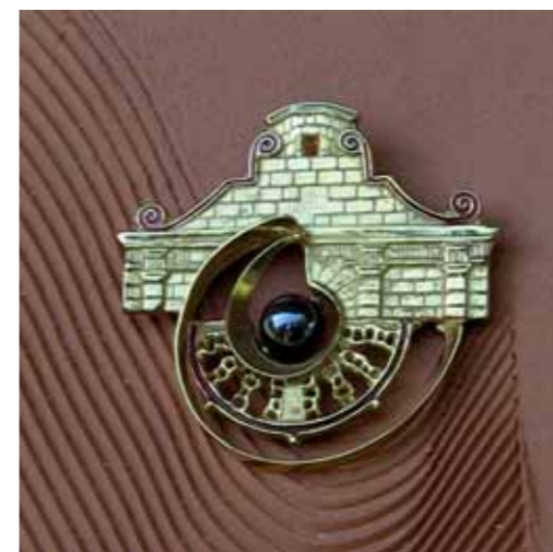
SPILLA IN ORO 750‰ e patinata oro con sfera (onix)