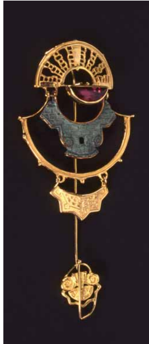
SPILLA IN ORO 750‰ con gemma tormalina e bronzo