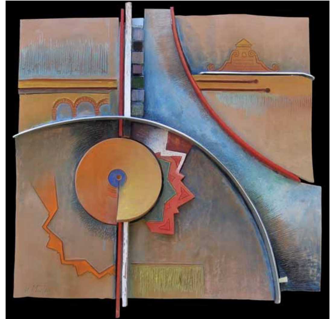
INTERMEZZO GEOGRAFICO OPERA MATERICA POLICROMA Tessere di mosaico e metallo, cm 100x80