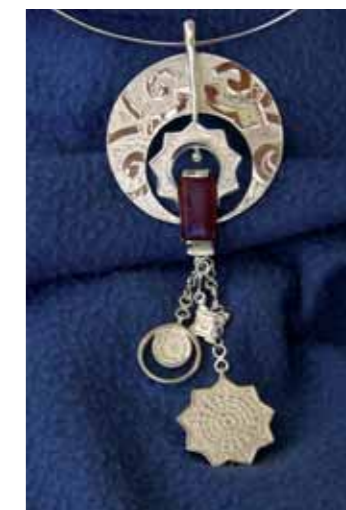
PENDENTE IN ARGENTO 925‰ e pasta vitrea