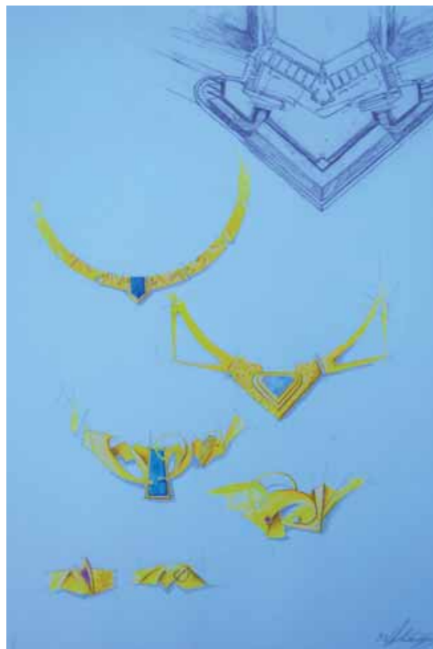
BOZZETTO per un centrale in oro 750‰ e gemma