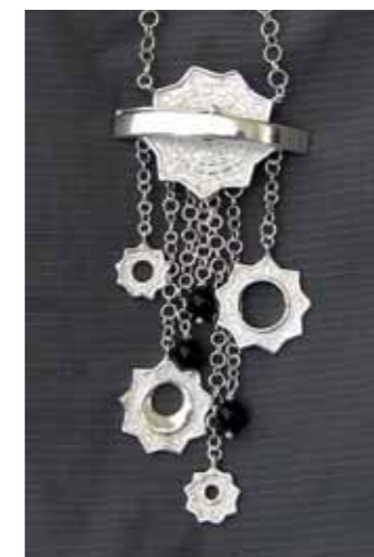
PENDENTE IN ARGENTO 925‰ e pietre onix