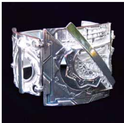
BRACCIALE IN ARGENTO 925‰ con particolare patinato