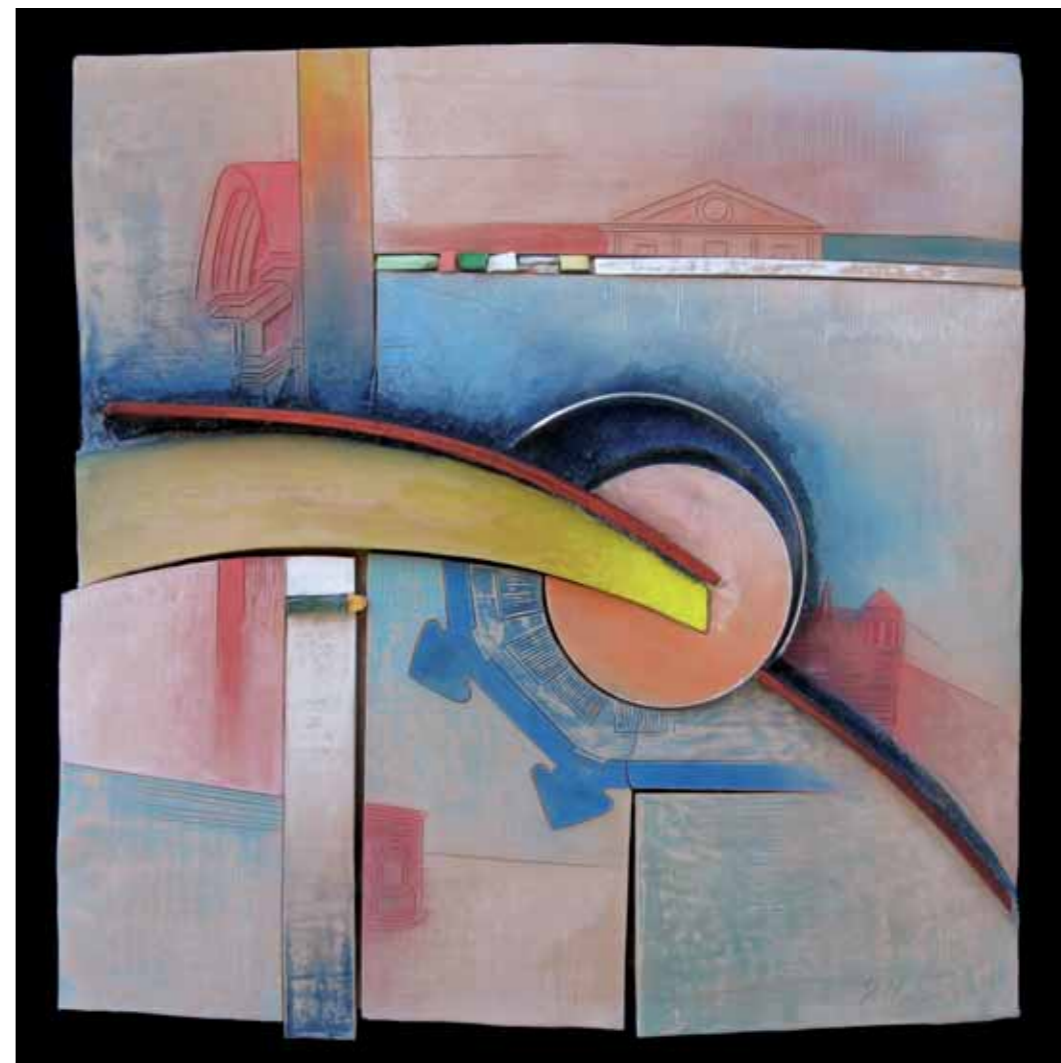
VERSO L'INFINITO OPERA MATERICA POLICROMA Legno, metallo e tessere di mosaico, cm 60x60