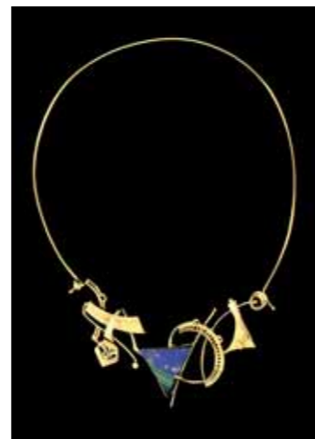
GIROCOLLO CON CENTRALE IN ORO 750‰ e gemma