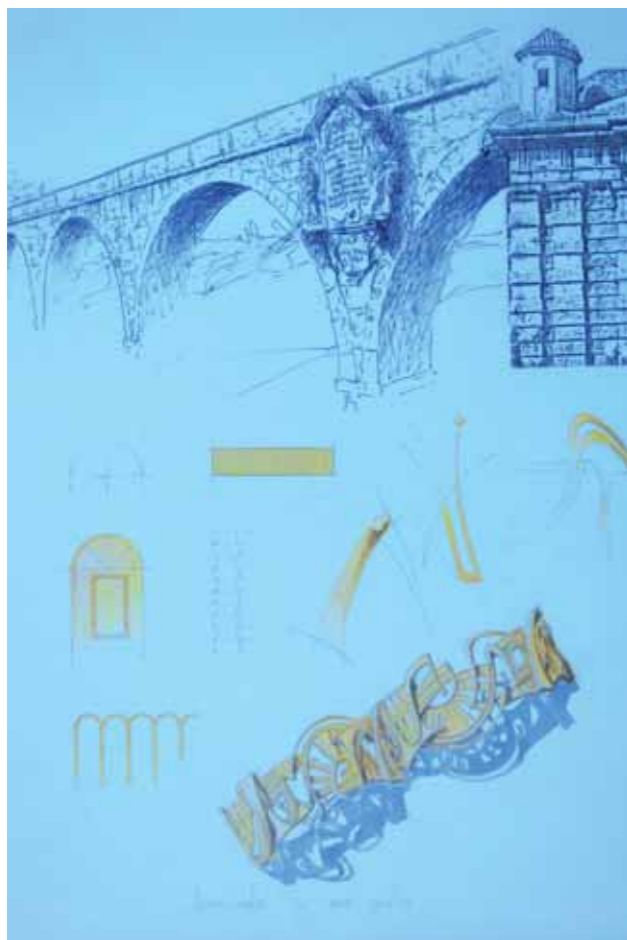
BOZZETTO per un bracciale in oro 750‰