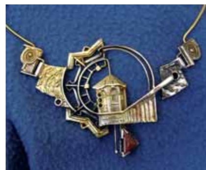
CENTRALE CON ARGENTO 800‰ e patina oro