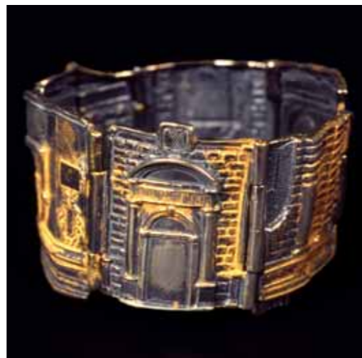
BRACCIALE IN ARGENTO 800‰ e patina oro con particolari