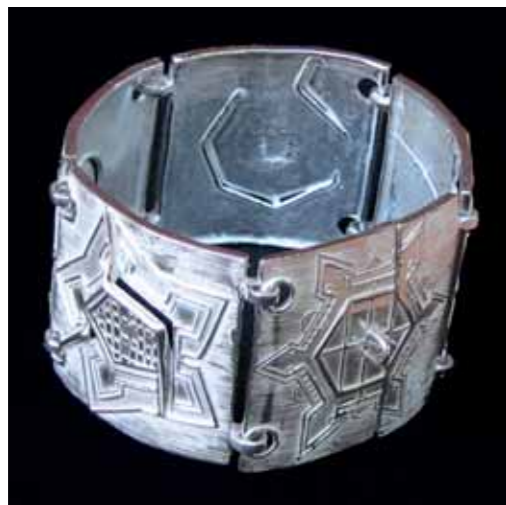
BRACCIALE IN ARGENTO 925‰ "Modulare"