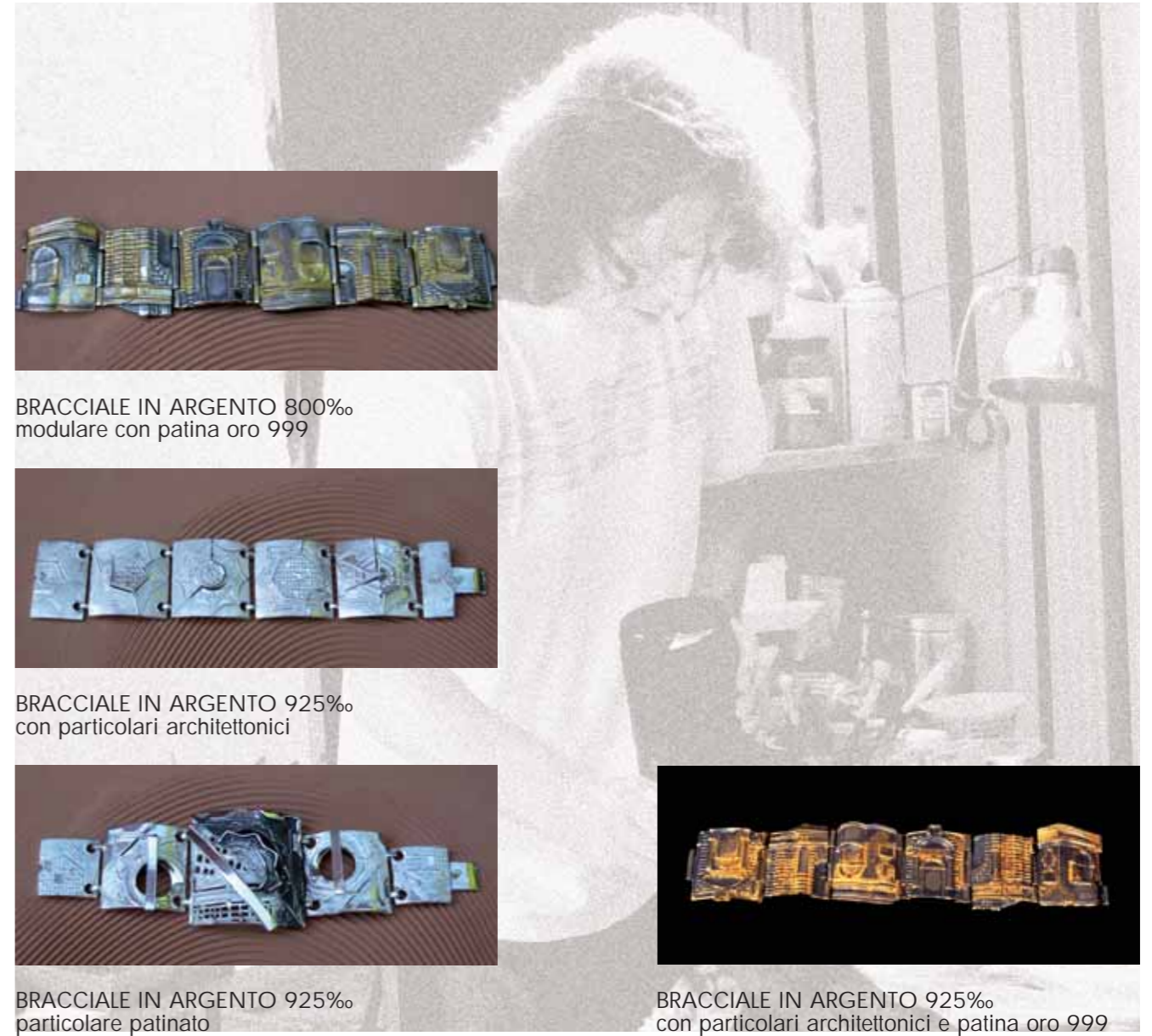
BRACCIALE IN ARGENTO 800‰ modulare con patina oro 999