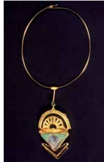
PENDENTE IN ORO 750‰ e pasta vitrea