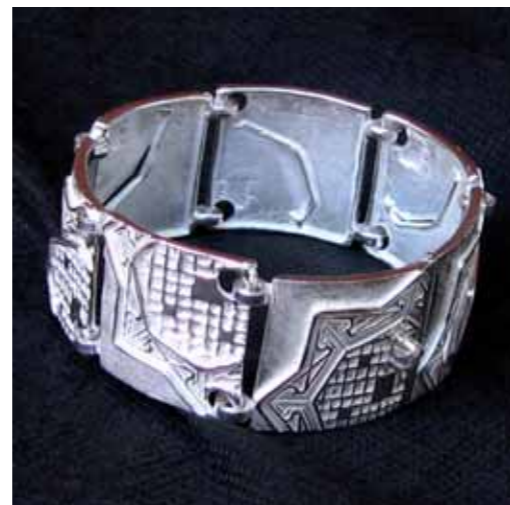
BRACCIALE IN ARGENTO 925‰ "Modulare con particolari"