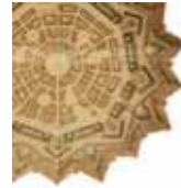
Città di Palmanova

Le creazioni artistiche di Piero De Martin sono il risultato di molteplici e attente ricerche elaborate sul piano tecnico con l'utilizzo di variegato materiale: dai metalli, alla terracotta, alla pietra e alla carta.