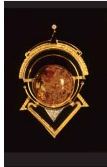
SPILLA IN ORO 750‰ con centrale in ambra onix e diamanti