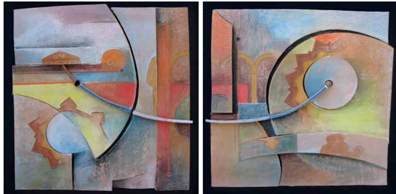
SPECCHIATE GEOMETRIE DITTICO/OPERA MATERICA POLICROMA e legno, cm 100x55