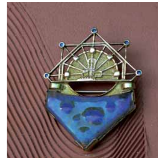
SPILLA IN ORO 750‰ pasta vitrea e smalti