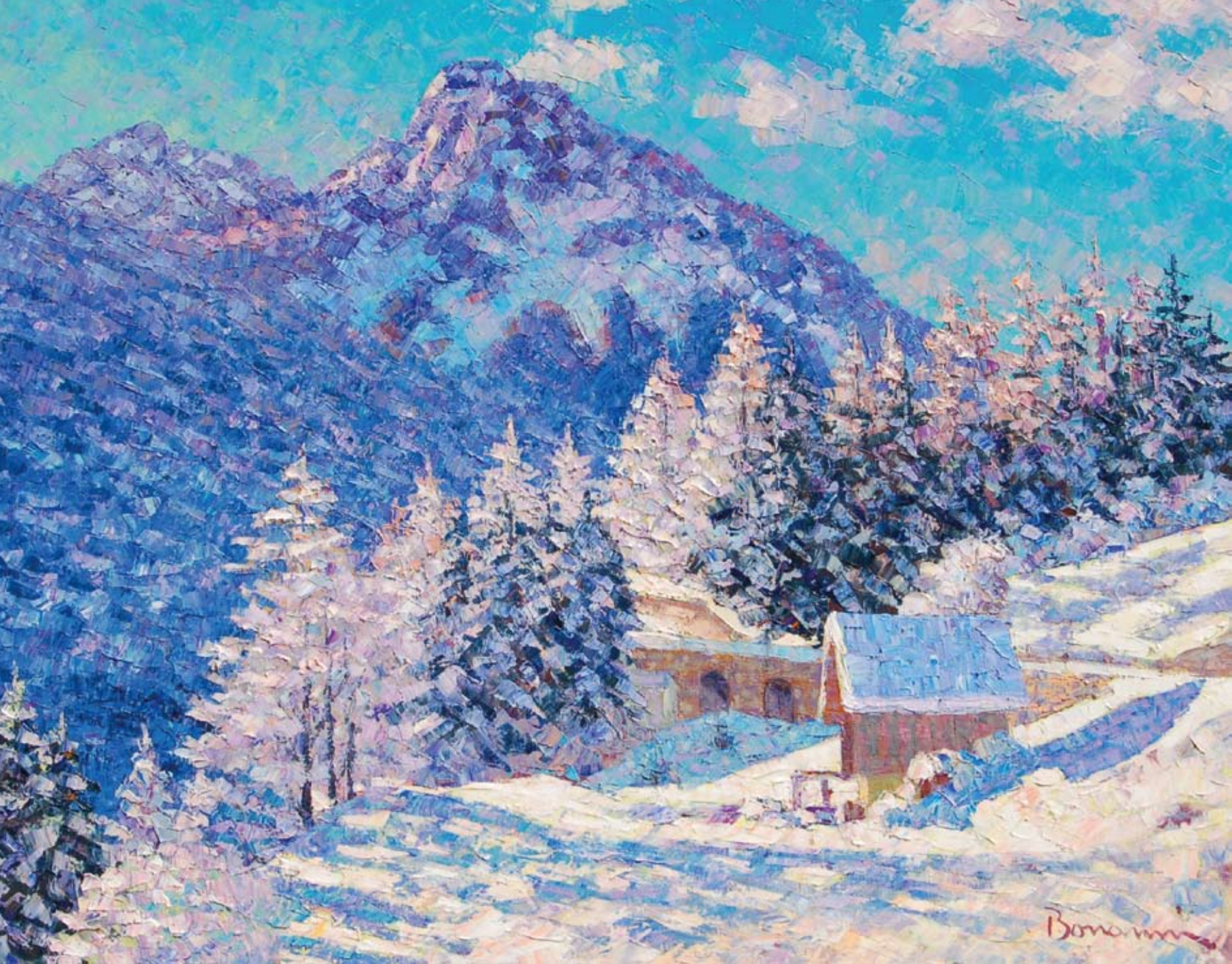
Piccola baita a Forni Avoltri