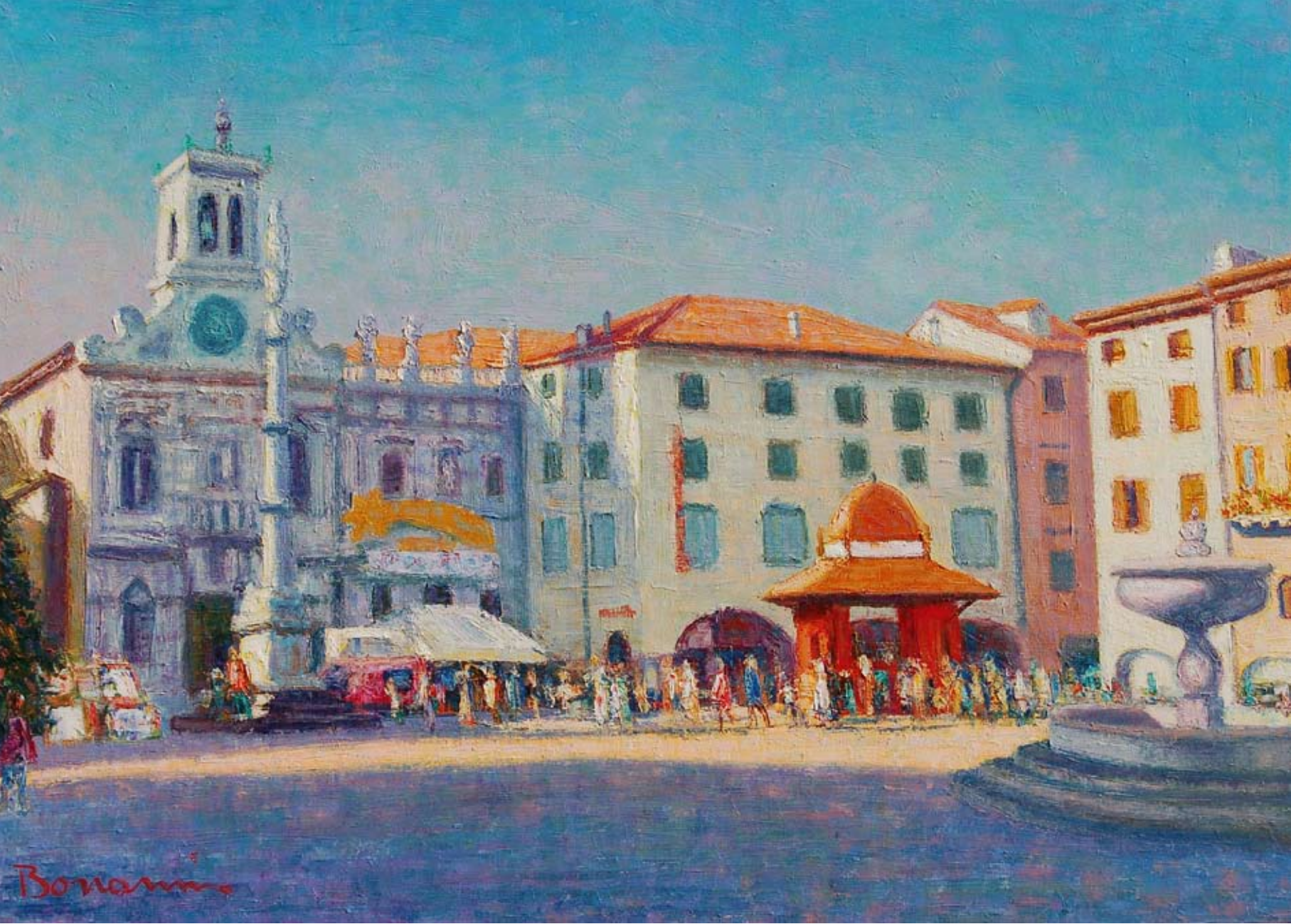
Piazza San Giacomo