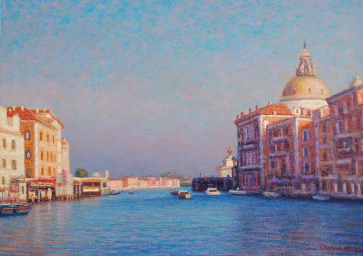
Canal grande a Venezia