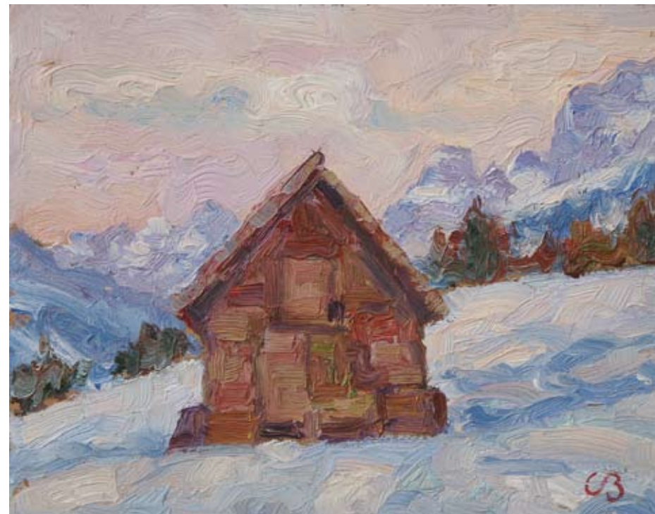
Stavolo a Valbruna