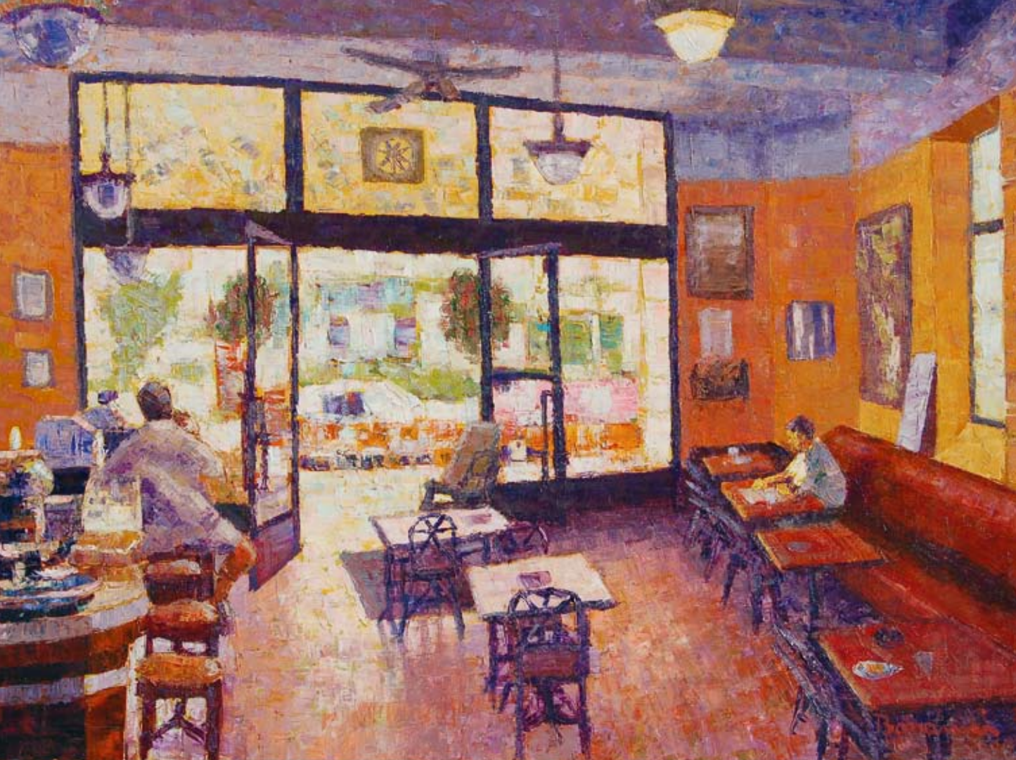
Interno di bar